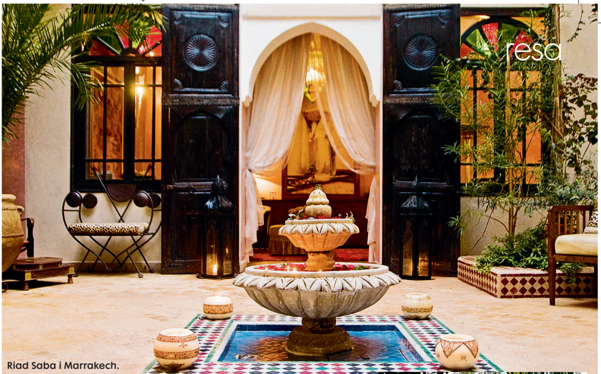
Riad Saba i Marrakech.

REDAKTÖR: MARIA SOXBO AV MARIA SOXBO, ANDERS BERGMARK FOTO: MARIA SOXBO, PRESSBILDER, BEACHES: 100 ULTIMATE ESCAPES, SABRINA TALARICO OCH STEFANO PASSAQUINDICI (REDI), UNIVERSE PUBLISHING 2011.