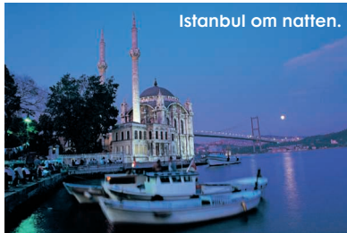
Istanbul om natten.